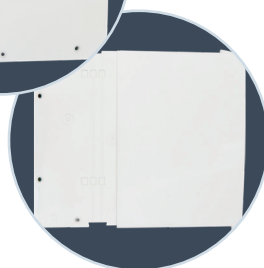
Coffre avec cache joues