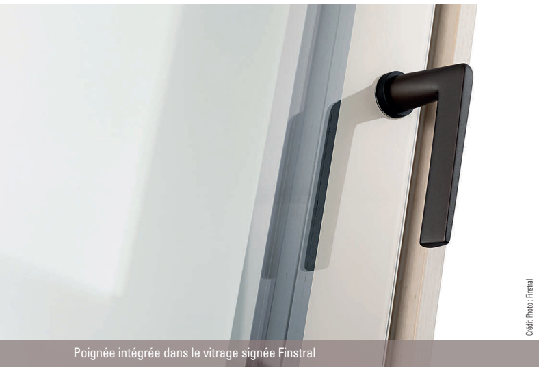
Poignée intégrée dans le vitrage signée Finstral